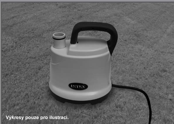
Výkresy pouze pro ilustraci.

Nezapomeňte vyzkoušet i jiné skvělé výrobky Intex: bazény, bazénové příslušenství, nafukovací bazény a domácí hračky, matrace a lodě, které jsou k dispozici u znamenitých prodejců, nebo navštivte naše webové stránky.